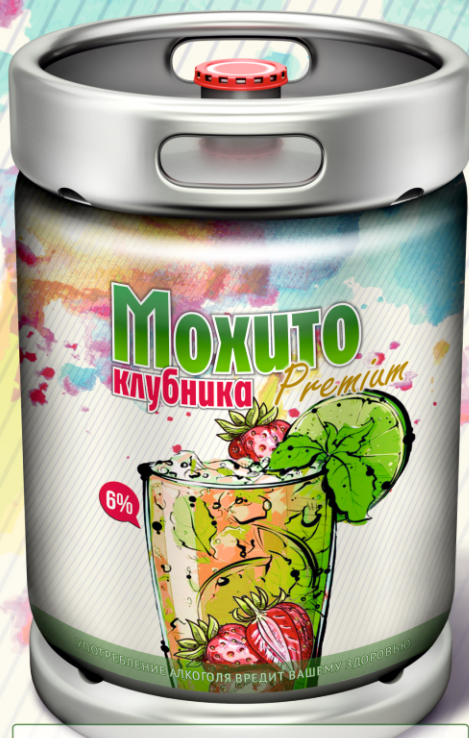
Мохито клубника Premium