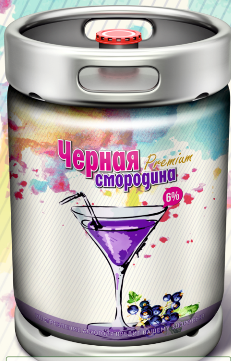
Черная смородина Premium