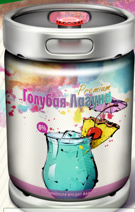
Голубая Лагуна Premium

Упаковка: металлические кеги 30 л. и 50 л. Изготовлена по ГОСТ Р 57594-2017. Объемная доля этилового спирта 5,4%. Срок реализации 6 месяцев со дня розлива.