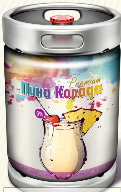
Пина Колода Premium