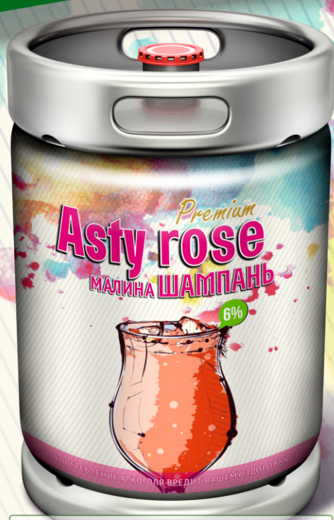
Asty rose ШАМПАНЬ малина Premium

Упаковка: металлические кеги 30 л. и 50 л. Изготовлена по ГОСТ Р 57594-2017. Объемная доля этилового спирта 5,4%. Срок реализации 6 месяцев со дня розлива.