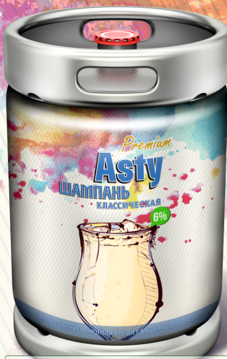
Asty ШАМПАНЬ классическая Premium