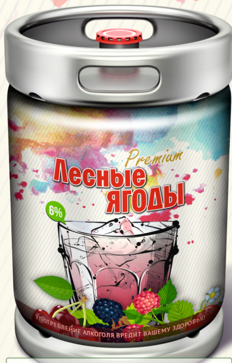
Лесные ягоды Premium

УПОТРЕБЛЕНИЕ АЛКОГОЛЯ ВРЕДИТ ВАШЕМУ ЗДОРОВЬЮ